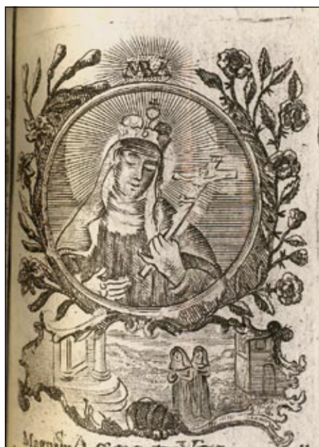
Obrázek č. 6: Sv. Anežka – OSzK, sign. 325.846.

světců, kteří byli v Uhrách nejvíce uctíváni, nejen uherských patronů a „lokálních“ svatých. Obrázky se v těchto sériích řadili podle církevního roku. Najdeme zde i vyobrazení českých světců, např. sv. Anežky České (6. března), sv. Vojtěcha (23. dubna), sv. Jana Nepomuckého (16. května), blahoslaveného Hroznaty (14. června), sv. Ivana (24. června), sv. Prokopa (4. července), sv. Ludmily (16. září) a sv. Václava (28. září).