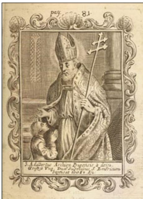
Obrázek č. 3: Sv. Vojtěch.