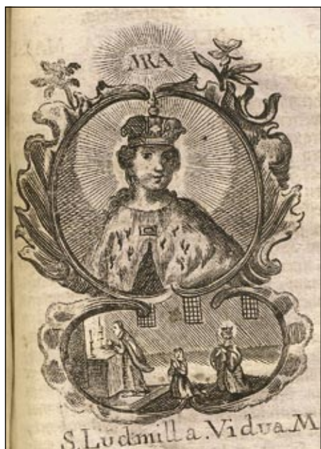
Obrázek č. 15: Sv. Ludmila – OSzK 319.678.