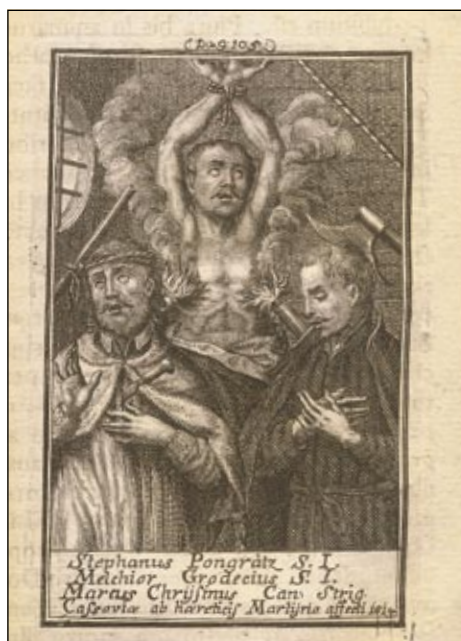
Obrázek č. 5: Svatí košičtí mučedníci.