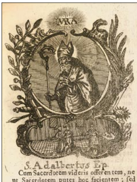
Obrázek č. 9: Sv. Vojtěch – OSzK, sign. 324.915. (latinsky)