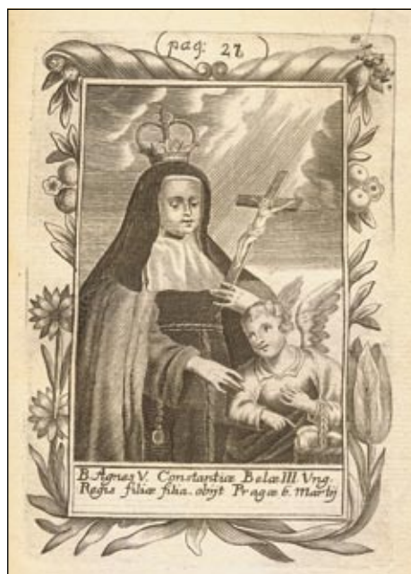
Obrázek č. 2: Sv. Anežka Česká.

Vratislava II. a Adléty [Adelhaidy], dcery uherského krále Ondřeje I. – Amabily (†ca 1170), 3 Alžběty (†1170), 4 Anežky, 5 Hedviky 6 a Markéty 7 – a jejich pravnoučat – Vojtěcha (†1260), 8 Angély 9 a Eufraziie. 10 Stejně tak se v obou dílech objevuje krátký životopis cisterciácké řeholnice sv. Hedviky (†1243), sestry královny Gertrudy (manželky uherského krále Ondřeje II.), která po otci pocházela z Moravy, 11 a dcery Přemysla Otakara I. sv. Anežky České 12 a sv. Kunhuty Pražské. 13 U Hevenesihho najdeme i portréty sv. Anežky České a sv. Hedviky.