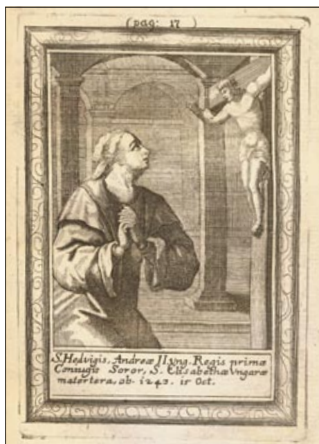
Obrázek č. 1: Sv. Hedvika.