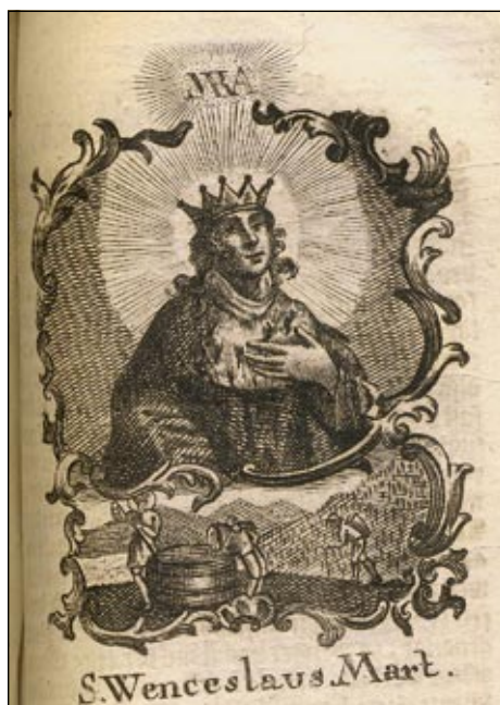
Obrázek č. 16: Sv. Václav – OSzK 319.678.