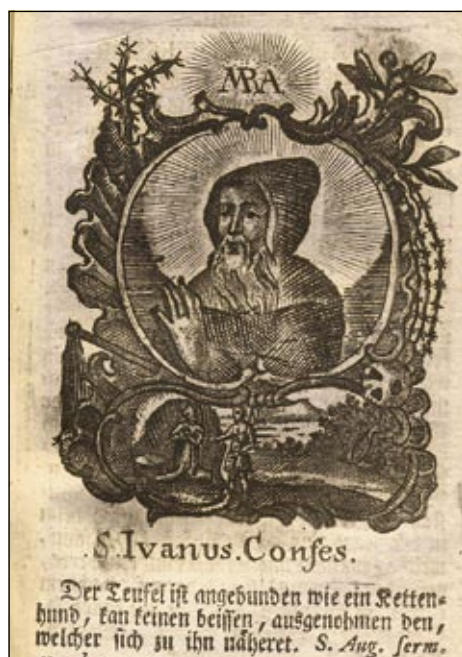
Obrázek č. 13: Sv. Ivan – OSzK 319.378.

Na Filozofické fakultě Katolické Univerzity Petra Pázmánye v Budapešti vystudovala historii a bohemistiku. Teď pracuje v Národní knihovně Széchényiho (Országos Széchényi Könyvtár, Budapest) v „sekcí pro výzkum z oblasti knižních a kulturních dějin“ jako vědecká pracovnice. Ve svém bádání se věnuje česko-uherským historickým a kulturně-historickým vztahům, českým a slovenským tiskům na území Uher do roku 1800, dějinám jezuitského řádu v Uhrách do roku 1773 a dějinám knižní kultury v Uhrách v 16.–18. století.