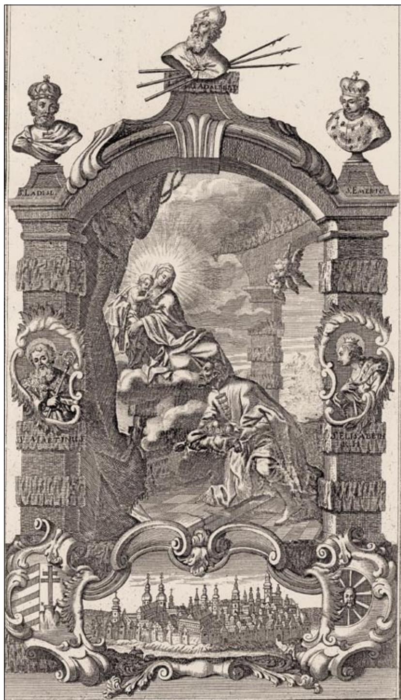
Obrázek č. 7: Sv. Vojtěch mezi uherskými svatými – Szabó I. Három esztendőre... (viz poznámka pod čarou 26).