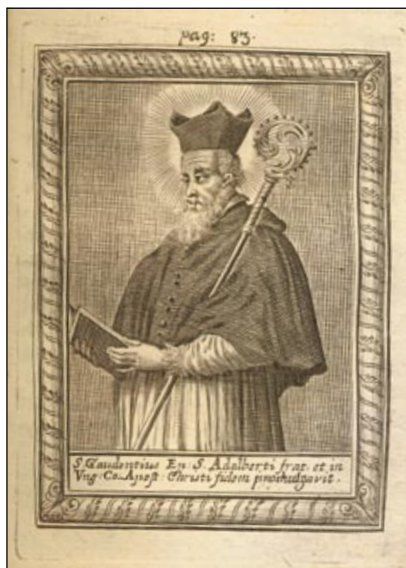
Obrázek č. 4: Sv. Radim.

Hevenesi zde cituje vedle Balbína i Dubravia. 16 Kvůli oblastnímu principu řadil mezi uherské světce i sv. Cyrila a sv. Metoděje. 17