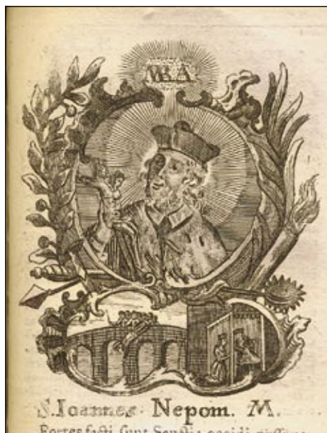
Obrázek č. 11: Sv. Jan Nepomucký – OSzK, sign. 324.915.