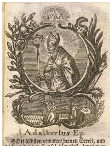
Obrázek č. 10: Sv. Vojtěch – OSzK, sign. 319.678. (německy)

Textová příloha k obrazu poustevníka sv. Ivana pochází také z kroniky Václava Hájka. I když je hodně známých legend o uherských vztazích sv. Ivana, tady o nich nenajdeme zmínku. Zobrazení poustevníka Ivana je v obou verzích velmi podobné, zobrazovaná scéna je v sérii C jeho setkání knížetem Bořivojem a se sv. Ludmilou, v sériích D, E s Janem Křtitelem, který mu předal kříž, aby ho posilnil v boji proti pokušení. I tady je významný rozdíl v kvalitě práce mezi sérií C a pozdějšími sériemi. Střední obraz v sérii C je podrobnější, ale rámec portrétu v pozdější verzi je pozoruhodnější. V sériích D, E je rámec portrétu často vykreslen podle osobnosti zobrazeného, proto portrét sv. Anežky České je v růžovém věnci, ve věnci kolem portrétu sv. Jana Nepomuckého a sv. Vojtěcha jsou skryty meč a kopí, které odkazují na jejich násilnou smrt. Rámec portrétu sv. Ivana obsahuje bič, trny a lebku, jež symbolizují jeho tvrdé pokání a asketický život.