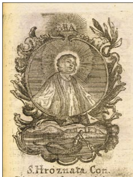
Obrázek č. 12: Bl. Hroznata – OSzK, sign. 324.915.

zbožnou modlí se Ludmilou s dítětem (asi s sv. Václavem) během mše svaté. Pozdější série D, E ji zobrazují stejně, ale zobrazení je mnohem jednodušší. Namísto růžového věnce je obyčejný rokokový lístkový věnec, portrét Ludmily je také méně vypracovaný, na hrdle má perlový náhrdelník namísto závoje, nosí korunu a plášť z hranostaje. Scéna ze života je stejná, ale také v jednodušší formě.