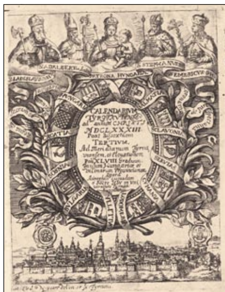
Obrázek č. 8: Calendarium... 1683 (viz poznámka pod čarou 26).

Mezi obrazy najdeme i méně známé světce, např. blahoslaveného Hroznatu. Texty k jeho obrazu vycházejí z kroniky Václava Hájka z Libočan. Stejně jako v dalších případech je obraz v sérii C je kvalitnější, ale významné ikonografické rozdíly mezi sériemi nejsou. Hroznata na obou verzích nosí kněžské šaty, jako scéna z jeho života je použit příběh jeho zázračné záchrany z řeky Visly.